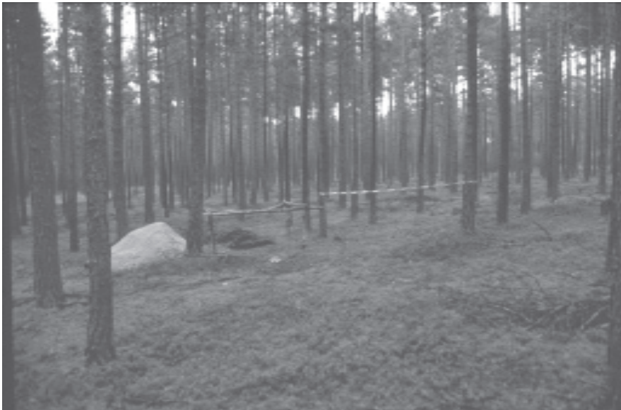
Foto 1: Standort 1a. Ein für den heutigen Reichswald typisches Bild: weite Teile des Waldes werden von schwachwüchsigen Kiefern beherrscht. Im Bildmittelpunkt erkennt man die Profilgrube

Nun mögen 50 bis 200 Jahre sehr kurz erscheinen, um weitreichende Veränderungen in Böden zu bewirken, doch gibt es zahlreiche Befunde, die solch rasche Entwicklungen bestätigen. Untersuchungen in dänischen Kiefernforsten haben z.B. gezeigt, dass sich in Aufforstungsflächen auf vormals bewegten Dünen bereits innerhalb eines Jahrhunderts Rohhumusdecken im Dezimeterbereich bildeten, die erhebliche Versauerungen und Auslaugungen der obersten mineralischen Horizonte von ebenfalls bis zu einem Dezimeter zur Folge hatten (STÜTZER 1998). Mehrere vergleichbare Beispiele nennt auch MILES (1985). In die gleiche Richtung weist zudem eine Untersuchung von EMMERICH (1995), der wahrscheinlich machen konnte, dass im Buntsandstein-Odenwald tiefgründig ausgelaugte Podsole mit mächtigen Ortsteinhorizonten innerhalb der letzten 700 Jahre entstanden sind. Besonders anfällig für solche rasch ablaufenden Stoffverlagerungen sind naturgemäß Böden, deren Ausgangssubstrate sehr geringe Pufferkapazitäten besitzen. Dies ist bei den Dünen- und Flugsanden im Nürnberger Reichswald der Fall, deren Quarzgehalt in der Regel über 90%, vielfach sogar über 95% beträgt (BERGER 1951; TRÄNKLE 1998). Ihr Restmineralgehalt ist demzufolge kaum in der Lage, die in den Boden eindringenden organischen Verbindungen langfristig zu neutralisieren und einer Versauerung entgegenzuwirken.