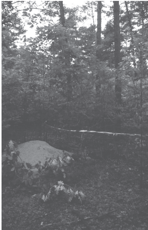
Foto 2: Standort 1b. Die Versuche, die Nadelbäume mit Laubhölzern zu unterbauen, zeigen überwiegend positive Ergebnisse. So könnte bereits in einigen Jahrzehnten aus dem Nadelforst wieder ein diversifizierter Mischwald werden

Um die Nadelbaum-Monokultur und die damit verbundenen Risiken und negativen Auswirkungen einzudämmen, gibt es seit etwa vier Jahrzehnten Bestrebungen der Forstämter, den Nürnberger Reichswald wieder in einen naturnahen Laub- und Mischwald zu restrukturieren (Foto 1 und 2). Es wird erwartet, dass dies auch einen positiven Einfluss auf die Böden hat, der das negative Prozessgefüge der vergangenen Jahrhunderte rückgängig macht. Zu den erwarteten Entwicklungen gehören vor allem eine (natürliche) Bodenverbesserung durch die Bildung günstigerer Humusformen und ein verbesserter Humusabbau. Damit verknüpft wäre eine Verbesserung im Säurestatus, die weitere vertikale Stoffverlagerungen und Stoffverluste verhindern soll (=Regradation). Mittelfristig wäre darüber hinaus eine Veränderung der Profilmorphologie zu erwarten, die durch eine Auflösung bzw. Durchmischung der Auslaugungs- und Anreicherungshorizonte und durch eine Entwicklung von Ober- und Unterböden gekennzeichnet ist, wie sie zumindest teilweise bereits in den ursprünglichen Böden vorhanden waren (=Depodsolierung).